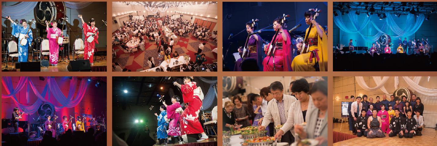
主催 / シャトーレストランベル・エポック

2015.7.12「絃と弦」CDリリース記念ディナーショーを「MRT micc ダイヤモンドホール」で開催いたしました。