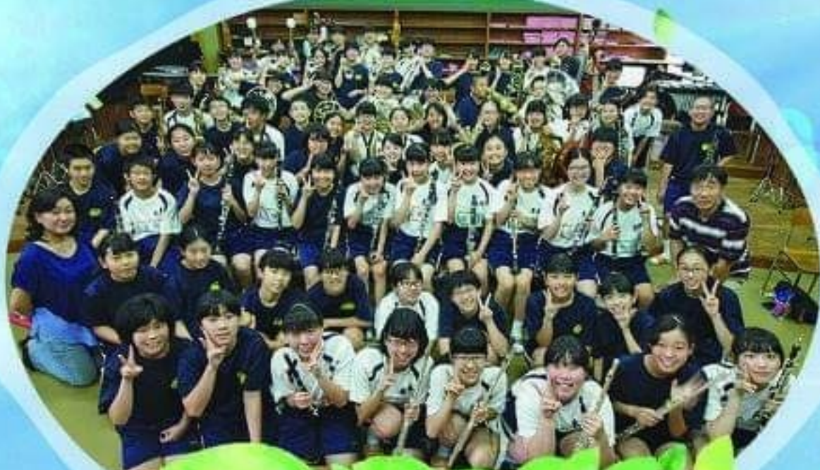
宮崎市立本郷中学校吹奏楽部