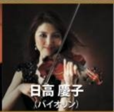
日高 慶子 (バイオリン)