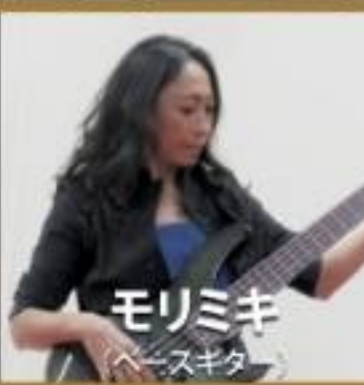
モリミキ (ベースギター)