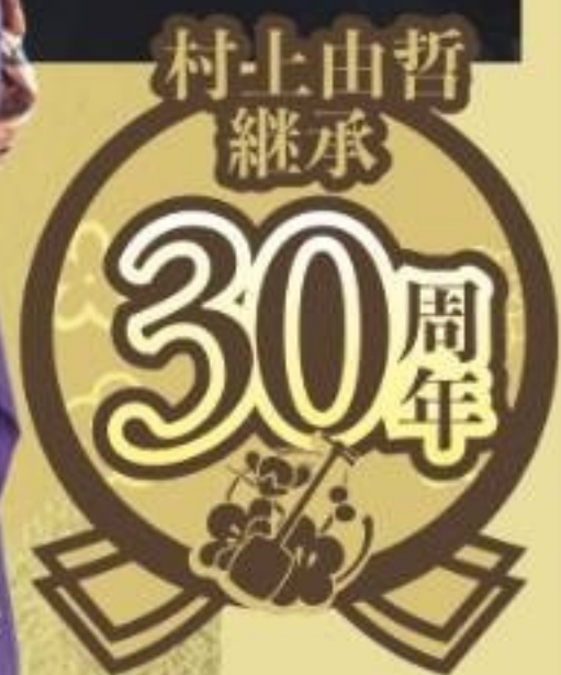
村上 由哲 (津軽三味線)